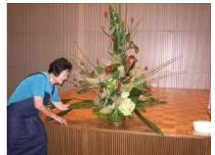
会場内の生花のアレンジ