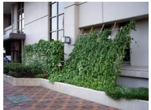
城南区役所玄関前