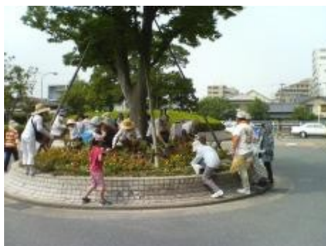
こども病院入り口のメインの花壇で わいわいがやがや植え付けの様子