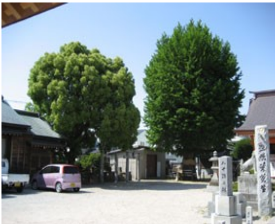
姪浜・住吉神社のイチョウとクスノキ

その条件には歴史的な背景は不可欠だと思います。新しいものの後ろにその背景が見出せる、重なりのある都市が成熟した都市であると思います。これからも歴史と現在～イマ～の共生を願って活動を続けていきたいと思っています。『唐津街道姪浜 町並み・まちづくり活性化協議会』は、この地域の活性化をはかるため、さまざまな企画を行っております。