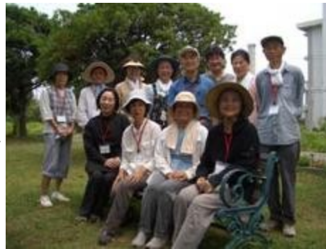
花の仲間たちみなさんと作業を終えて

一般企業・市民の方63名のボランティアが集まりました。九州がんセンターで活動されている「花の仲間たち」の皆さんがリーダーになって、それぞれのブロックに分かれて作業を開始しました。初めは花と雑草の区別もつかず、おそるおそるの作業でしたが、要領がわかると作業もどんどん進み、見違えるようなきれいな庭になりました。「花の仲間たち」の皆さんも、なかなか手がまわらない所まできれいにさせていただいて・・・と感謝されていました。暑い日で、沢山の汗をかいての作業でしたが、その分の達成感もあり、皆さんさわやかな顔でした。