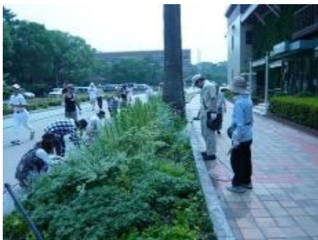
夏はカラミンサやブルーサルビアがさわやか