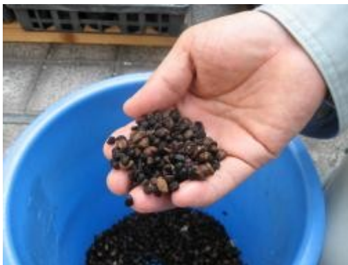
水に浸して膨らんだ種

4月11日（水）、朝顔のカーテン作りに取り組むキャナルシティ博多、イムズ、市役所などのメンバーで、イムズ屋上にて種まきをしました。まいた種は、昨年取れたものです。前日から水に浸しておき、少し膨らんで芽がでかかった種を、3～5粒ずつポットに植えていきました。なかなか芽が出て来ず、ハラハラしていましたが、今はほとんどの種が芽を出し、双葉から本葉がでてきています。