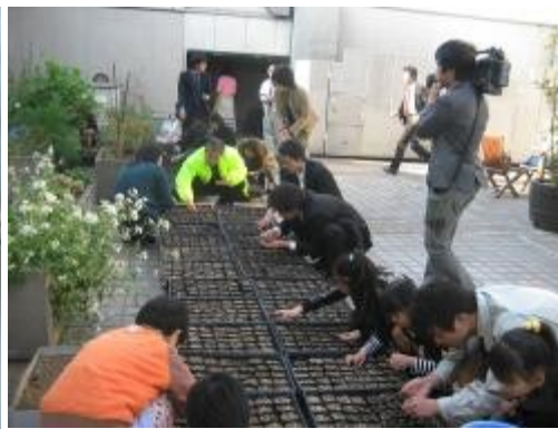
イムズ屋上での種まき