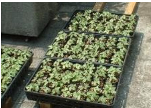
5月10日順調に育ってきました

芽が出た苗は、それぞれの施設で植え付けを行うことになり、市役所では、5月19日（土）10時から、職員のボランティアにより、プランターに植え替えをします。昨年よりさらにパワーアップした朝顔のカーテン。今年もたくさん花が咲くように、毎日水やりをがんばります。