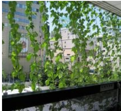
昨年の朝顔のカーテン

昨年のグリーンノートでも紹介した“朝顔のカーテン”。福岡市役所では、今年も実施します。昨年は、市庁舎4階のベランダのみでしたが、今年は4階5階6階13階と、エリアを拡大し、大きなカーテンを作る予定です。また、昨年同様、キャナルシティ博多、イムズ、大名紺屋町商店街でも展開します。さらに、天神コア、ソラリアプラザ、ソラリアステージなど、西鉄グループ関連の施設でも展開を予定しています。